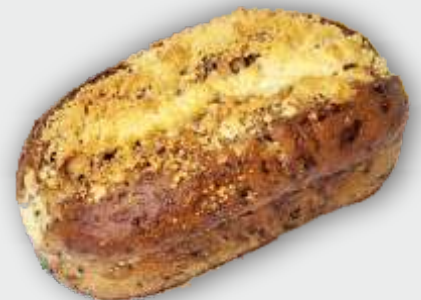
UNSERE SÜSSE SCHNUTE IMMER DONNERSTAGS BIS SAMSTAG