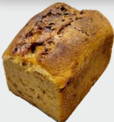
UNSER BRATKARTOFFELBROT IMMER VON DIENSTAG BIS SAMSTAG