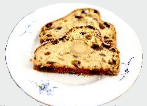
UNSERER BUTTERMANDARZIPAN-STOLLEN BIS WEIHNACHTEN, IMMER VON DIENSTAG BIS SAMSTAG