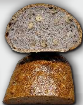
UNSER DOPPELNUSS IMMER VON DIENSTAG BIS SAMSTAG