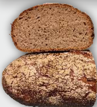
UNSER VINCHY IMMER MITTWOCHS UND AM FREITAG