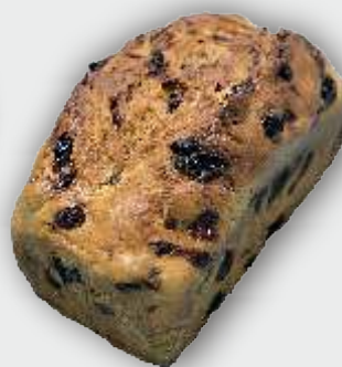
UNSER ROSINENSTUTEN IMMER DONNERSTAG AB 14:00 UHR BIS AUSVERKAUFT